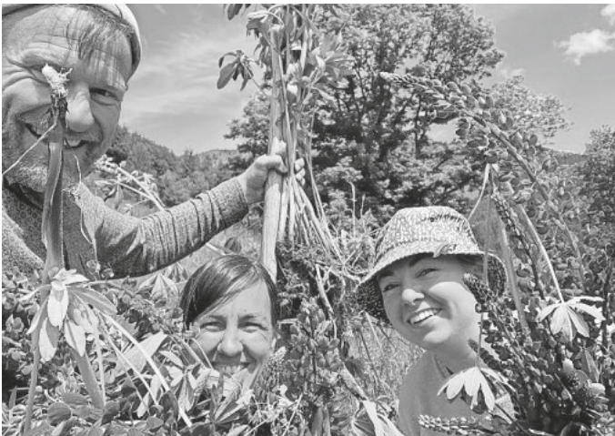
Lupinen entfernen macht Spaß