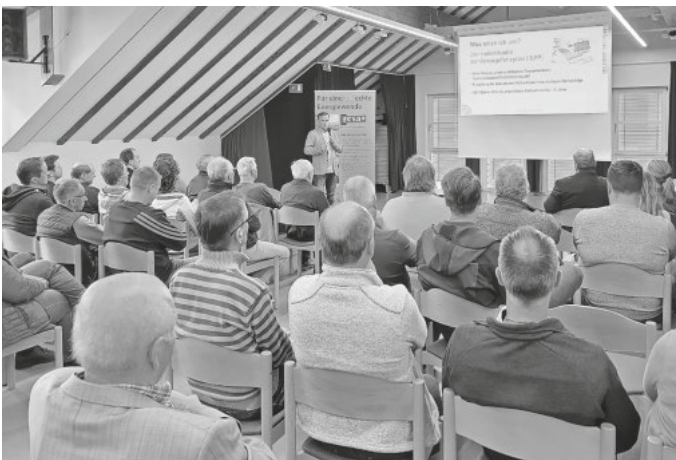
Am 12. Mai 2026 versammelten sich zahlreiche Bürgerinnen und Bürger aus den teilnehmenden Gemeinden im Bürgersaal Schönau zur Auftaktveranstaltung der Energiekarawane.

Die Energiekarawane ist ein Angebot der teilnehmenden Kommunen, des Landkreises Lörrach und des FESA e.V. in Kooperation mit der Verbraucherzentrale Baden-Württemberg.