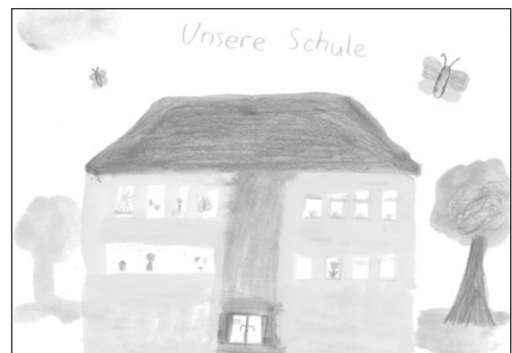
Das Bild zeigt das "neue" Schulgebäude, fertiggestellt im Jahr 1985 und stammt von einem früheren Malwettbewerb.