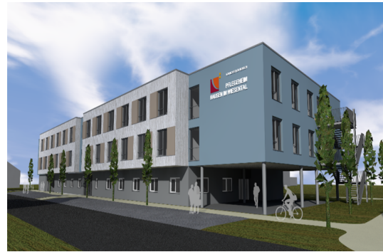
Entwurf Pflegeheim Hausen i. W.