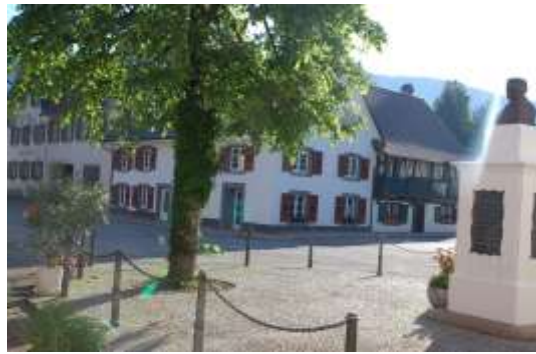
Blick auf das Hebelhaus