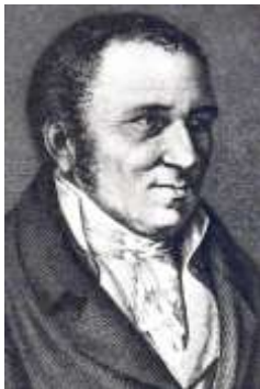
Johann Peter Hebel (1760 bis 1826)